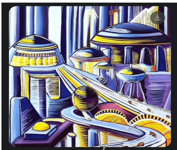
Imagen futurista. Autora: Valeria Mendizabal. Procesada por inteligencia artificial. Marzo 2025.

Los diferentes modos con que circula la información en las democracias y en los sistemas totalitarios le permite al autor arribar a un argumento potente que recorre toda la primera parte del libro constituyendo un tópico filosófico, en particular de filosofía política. Siempre desde la óptica de la información una pregunta sobrevuela todo el texto ¿Cuánto de la Verdad se sacrifica en aras del Orden y del Poder?